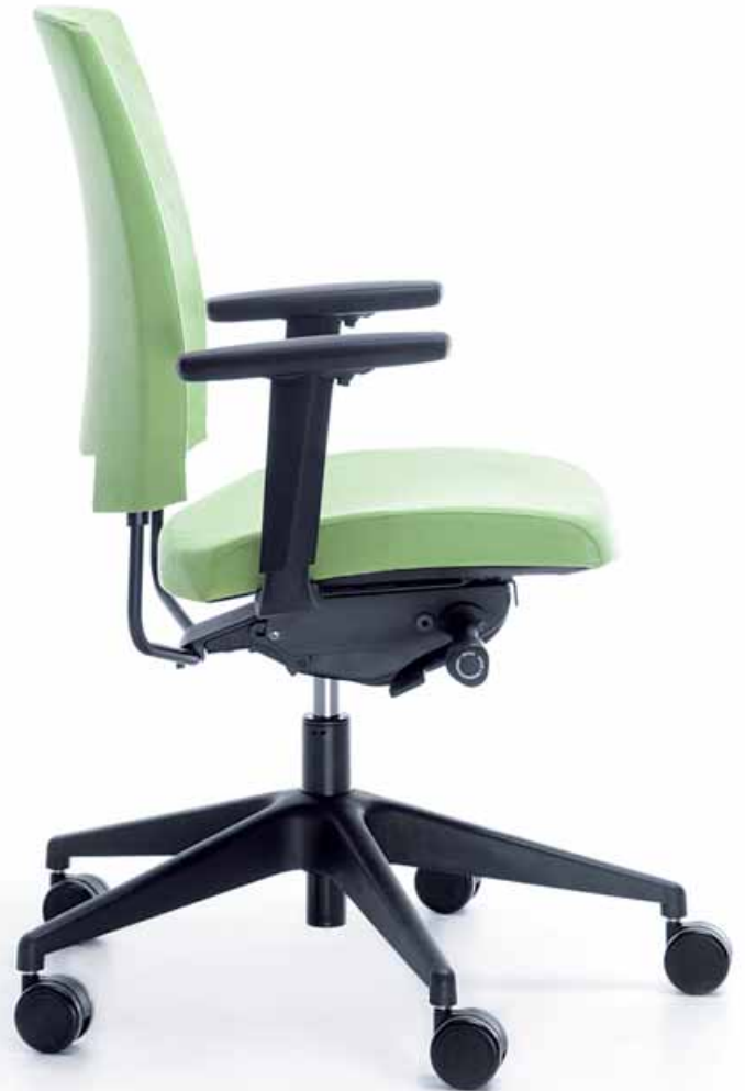
ARCA 21 SL BLACK P54 PU