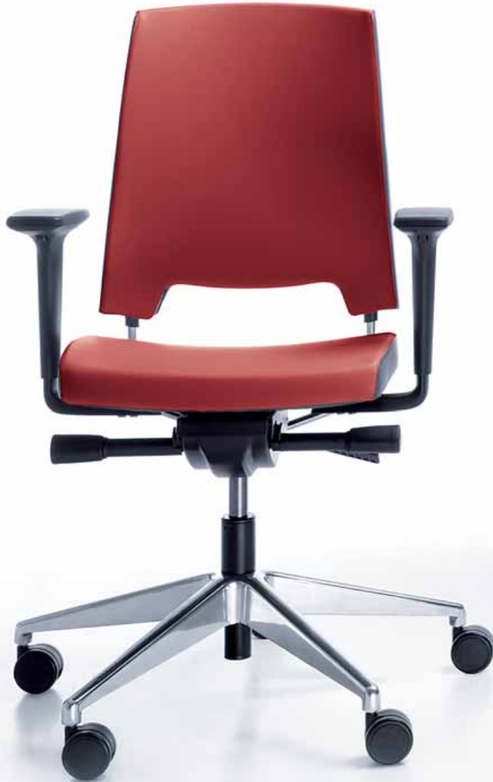
ARCA 21 SL CHROME P51 PU