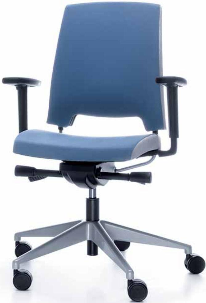
ARCA 21 SL METALLIC P54 PU