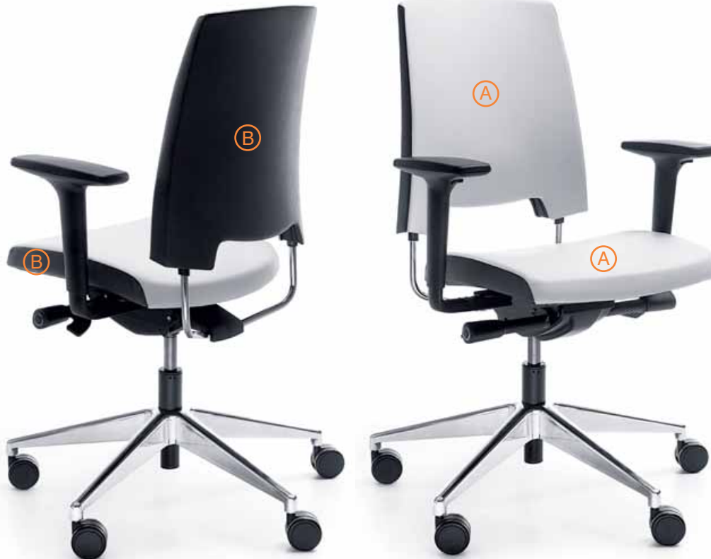
ARCA 21 SL CHROME P51 PU