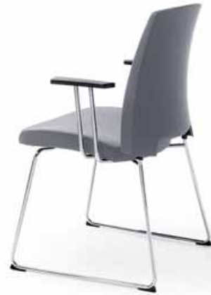
ARCA 21 V CHROME PP