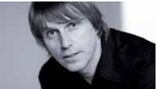
Design: Ronald Straubel