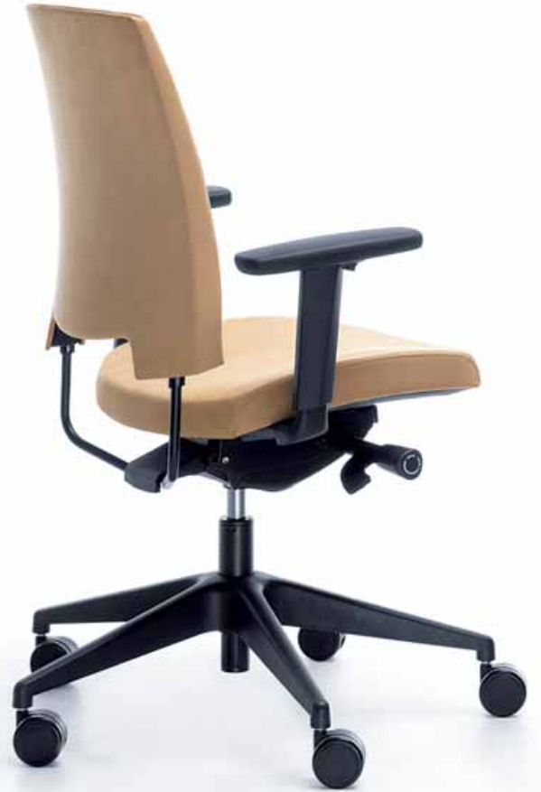
ARCA 21 SL BLACK P54 PU